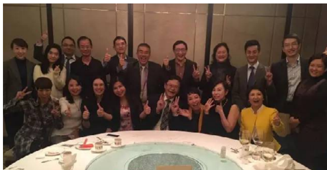
交流答谢晚宴合影

由香港特别行政区政府、香港贸易发展局及香港设计中心联合举办的第六届亚洲知识产权营商论坛（以下称“论坛”），于2016年12月1日-2日在香港会议展览中心举行。