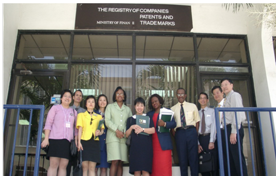
香港代表团于BVI公司注册处合影 右一：宏杰集团董事 何文杰会计师 右二：现任香港特区财政司司长 陈茂波 左五：BVI公司注册处官员

多年前，宏杰集团董事何文杰会计师曾与陈茂波司长一起带领过香港代表团对BVI政府及其公司注册处进行过访问。