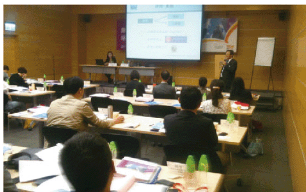
(现场企业家正认真倾听)