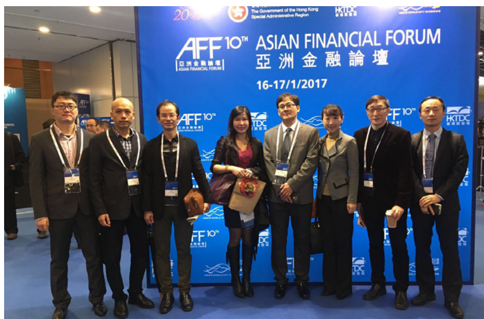
(第十届亚洲金融论坛 合影留念)