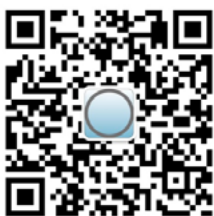
掃描二維碼 關注宏傑微信

香港作為國際金融中心，擁有成熟的證券交易市場，此次香港證監會與聯交所合作整頓創業板市場展示了香港政府維護市場穩定和良性發展的決心。接下來，對創業板進行更加廣泛的改革？或對香港證券市場規則通盤考慮？我們將持續為您關注！