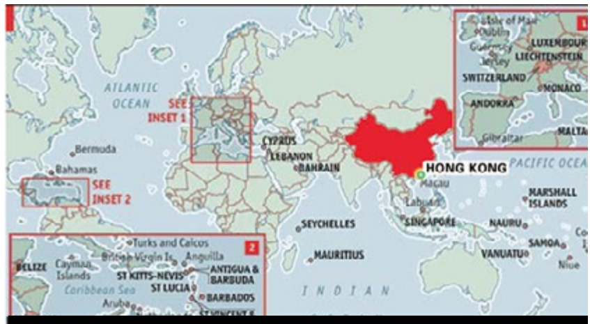
图六：香港区位优势图

针对 BVI 公司的这些“劣势”，香港公司与其形成了比较鲜明的对比，特别是对中国内地投资者来说，替代优势非常明显。